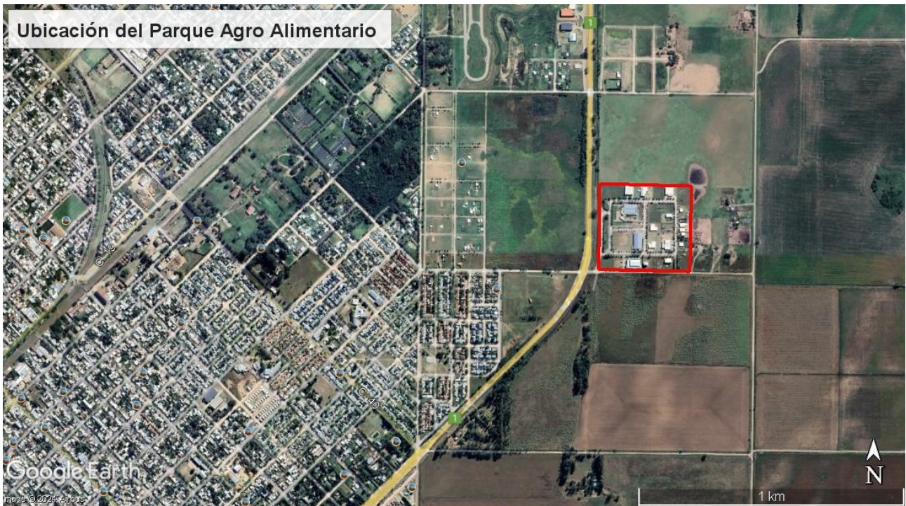
Figura 1: Ubicación del Parque Agro Alimentario

También no debe dejar de considerarse el impacto que genera en la localidad este tipo de obras en la generación de empleo y de oportunidades para empresas prestadoras de servicios.