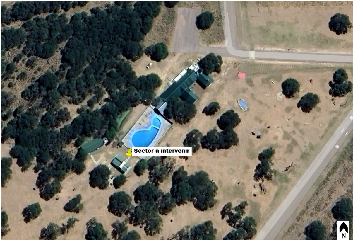
Sector a intervenir en la Reserva Natural Parque Luro