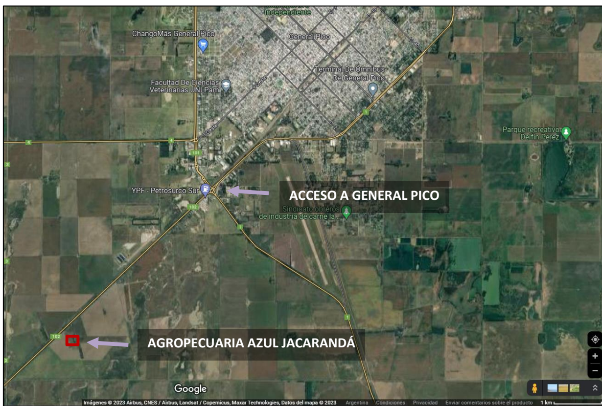
Figura N°2: Ubicación geográfica del proyecto.