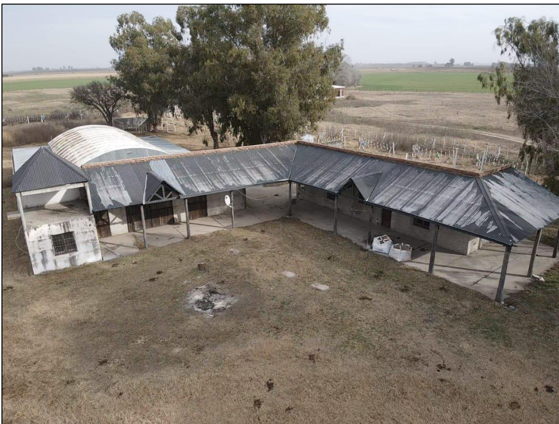
Figura N°1: construcción actual que se utilizará para el depósito y venta de agroquímicos.